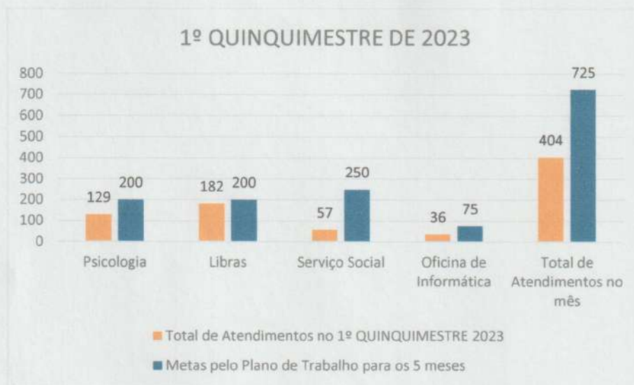
Gráfico 1. ATENDIMENTOS REALIZADOS NO 1º QUINQUIMESTRE DE 2023 POR SETORES